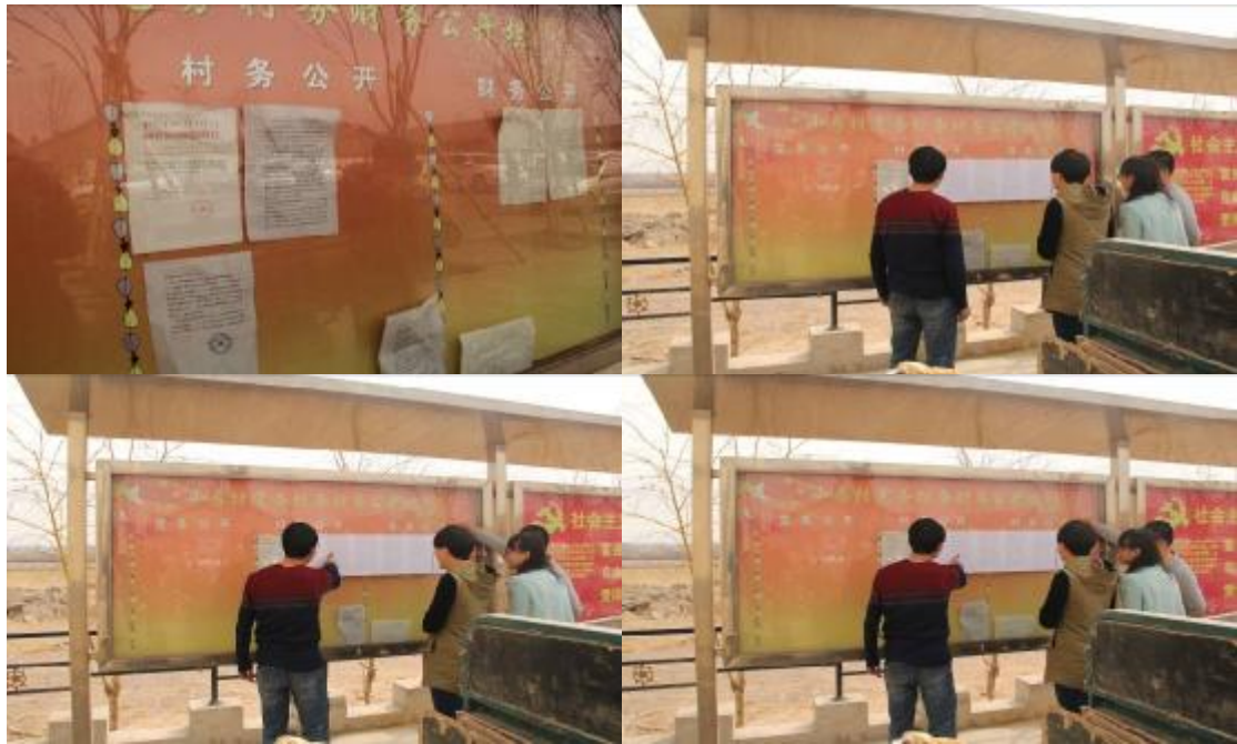
图 2.2-2 项目在小房村村村委会公告栏发布项目公示照片图