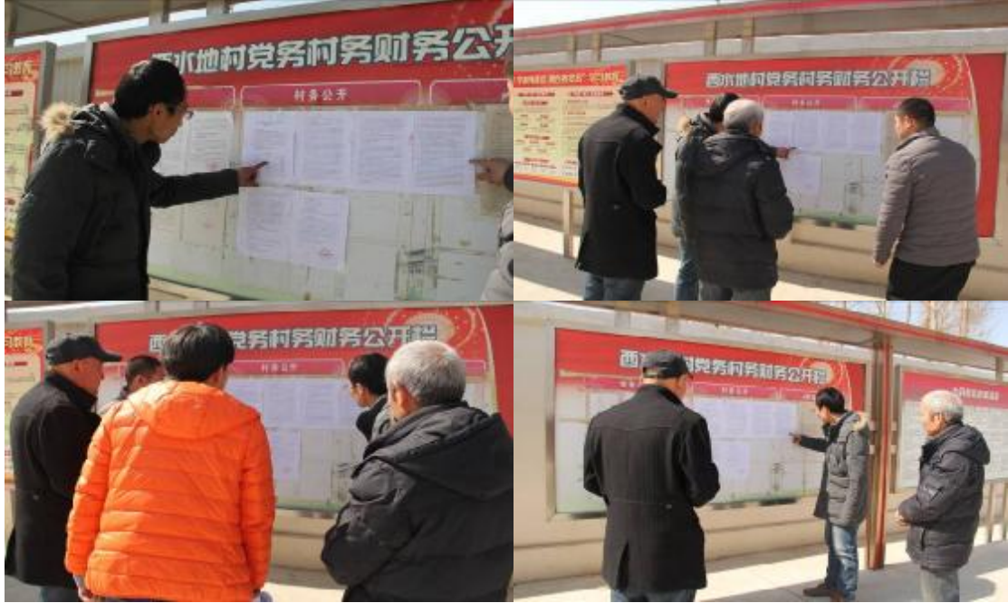
图 2.2-2 项目在西水地村村委会公告栏发布项目公示照片图

内蒙古天奇中蒙制药股份有限公司蒙药扫日劳清肺止咳胶囊智能生产线建设项目于2017年3月1日至2017年3月21日期间企业在项目评价范围内的敏感点处如小房村、西水地村和张卜郎营子的村委会公告栏内张贴了项目的环境影响评价公众参与公示。公示具体张贴情况见下图：